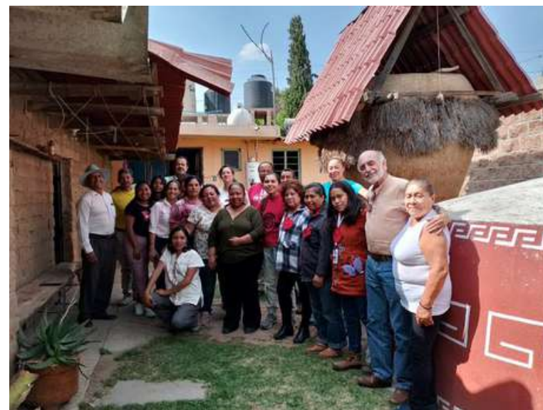
Grupo PTTAT en el Seminario Tlaxcala, instalaciones de Vicente Guerrero, Españita-Tlaxcala.

que ofrece sus saberes y experiencia para promover, acompañar y avalar la producción agroecológica; y en el ámbito de consumo, se encuentran los distribuidores solidarios y tiendas , tanto físicas como virtuales , tal es el caso del Colectivo Ecoalimentos y Nahui Ecotienda , en los que se ofrecen productos locales y actividades a favor de: la agroecología, las familias y grupos de consumidores y prosumidores en el territorio.