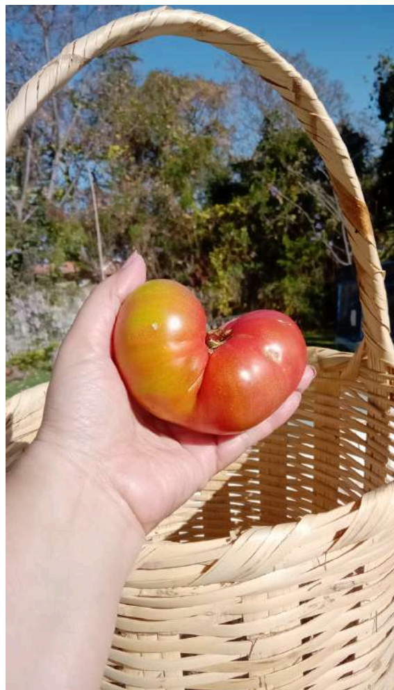
“Cosecha huerto agroecológico” 3 de marzo de 2023

La red ha sido punto de encuentro para diversas experiencias que representan esfuerzos colectivos y variados, organizados para enfrentar las crisis relacionadas al tema alimentario . Abarca 25 municipios en el estado y es a partir del abordaje de la producción, transformación, consumo responsable y educación alimentaria con un enfoque de sustentabilidad , que dan cuenta de su capacidad autónoma para dar respuesta, siempre con recursos propios.