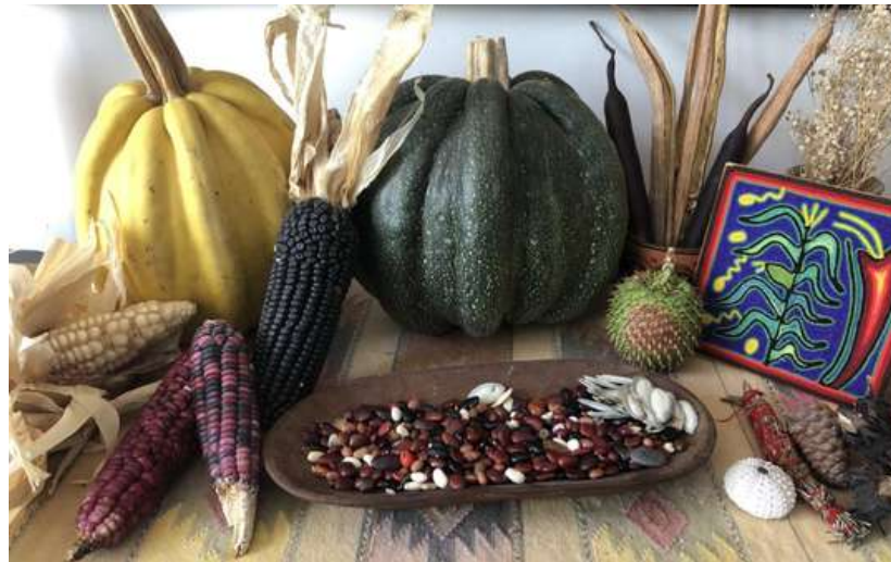
“Ofrenda a la milpa” Autora: Silvia L. Colmenero Querétaro, septiembre 2022

ambientales, que representa igualmente un espacio de convergencia para el intercambio de experiencias, saberes, trabajo colectivo (tequio), plántulas, semillas y alimentos.